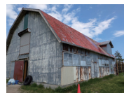
現在の犬舎。これが・・・