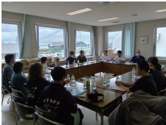
昨年8月に厚岸町で開かれた野犬対策についての意見交換会の様子。主に道東・釧根地域から複数の役場や振興局、保護団体、獣医などが参加しました。

国内の様々な場所において野犬問題が深刻化しています。中でもしおんの会のある浜中町周辺は日本最大の酪農地帯で、牛が野犬に襲われるという被害も出ています。酪農家の敷地内に住み着きそこで繁殖し増え広がるなど地域特有の問題もあり、野犬の保護が追いついていないのが実情です。野犬をこれ以上増やさない、不幸な犬を生まないために、関係各所が連携し、知恵と力を出し合っ事にあたる必要があります。昨年度から本格的な対策のための集まりが持たれるようになり、解決すべき問題は山積していますが一歩ずつ前に進み始めています。