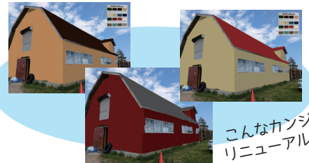
こんなカンジにリニューアル!?